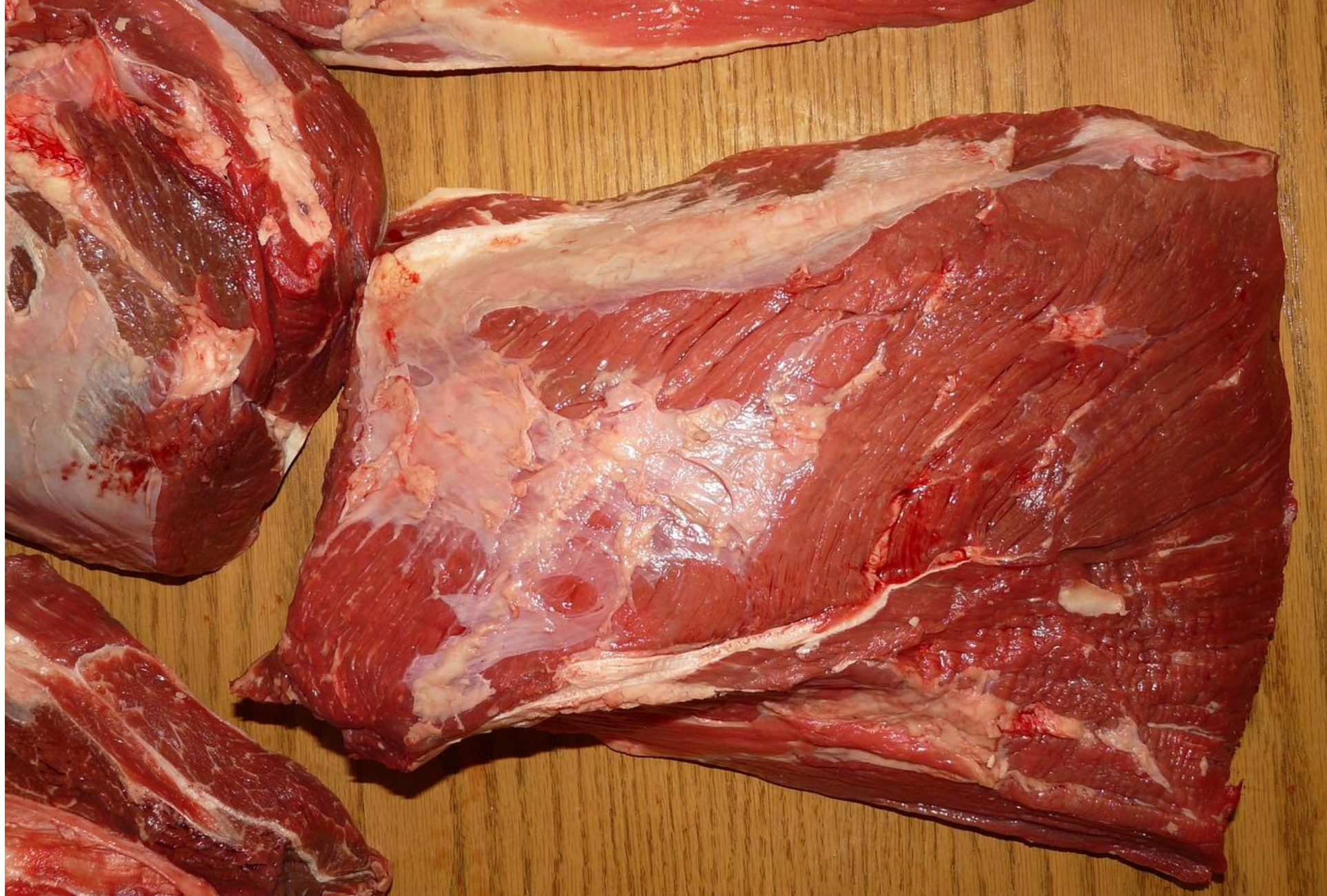
لحم البقر المشوي