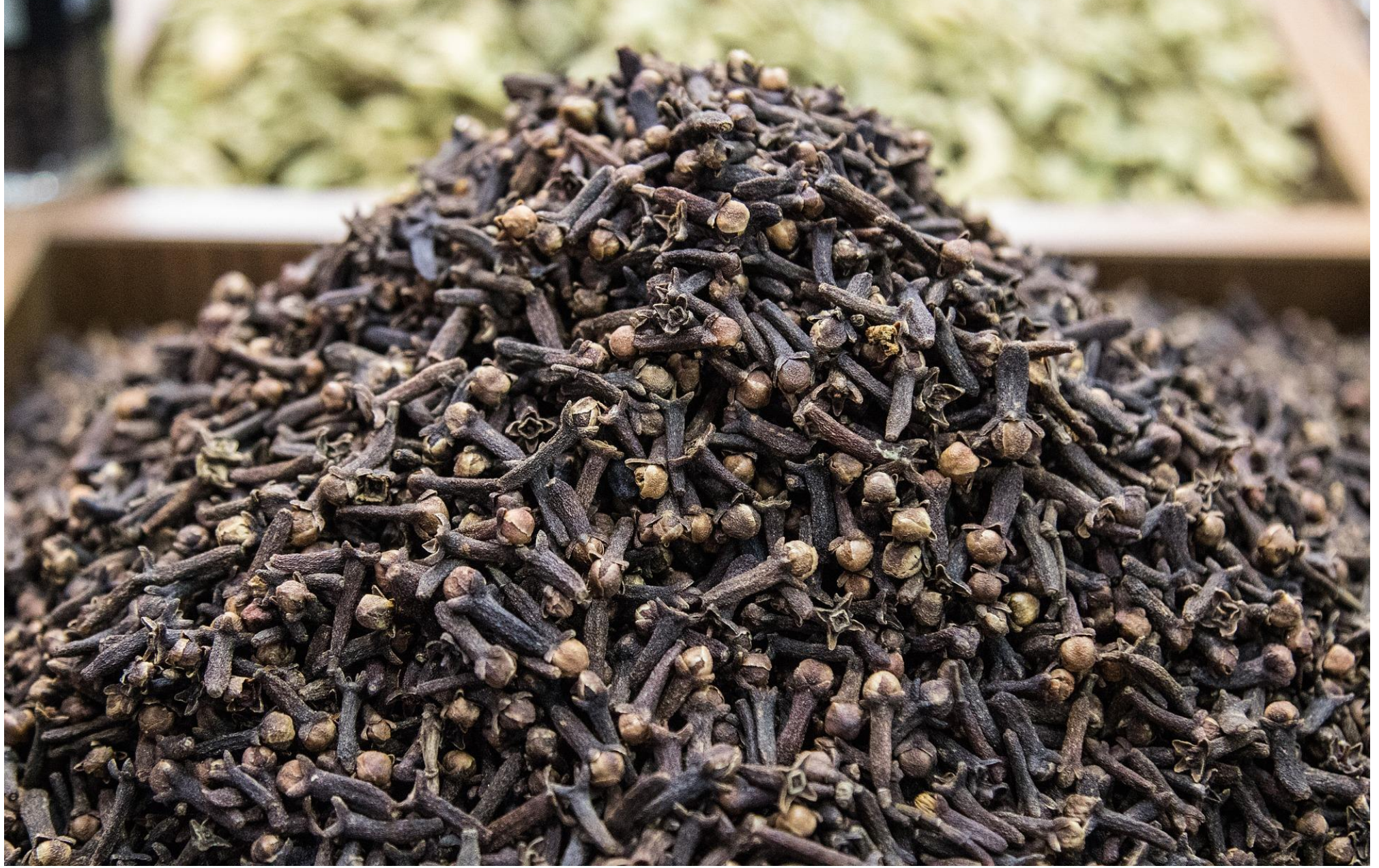
القرنفل - أصله جزر القمر